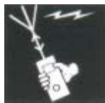
Aparell radioelèctric portatil