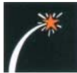
Coets amb estels vermells