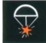
Coet bengala amb paracaigudes