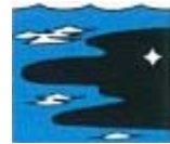
Marca colorant a l'aigua