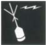
Radiobalirza de localització